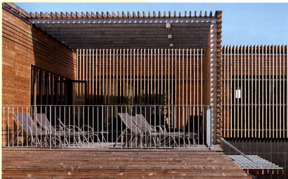
▲▼ Des ombrières en carrelés de Douglas protègent les terrasses de repos de la lumière vive méridionale.