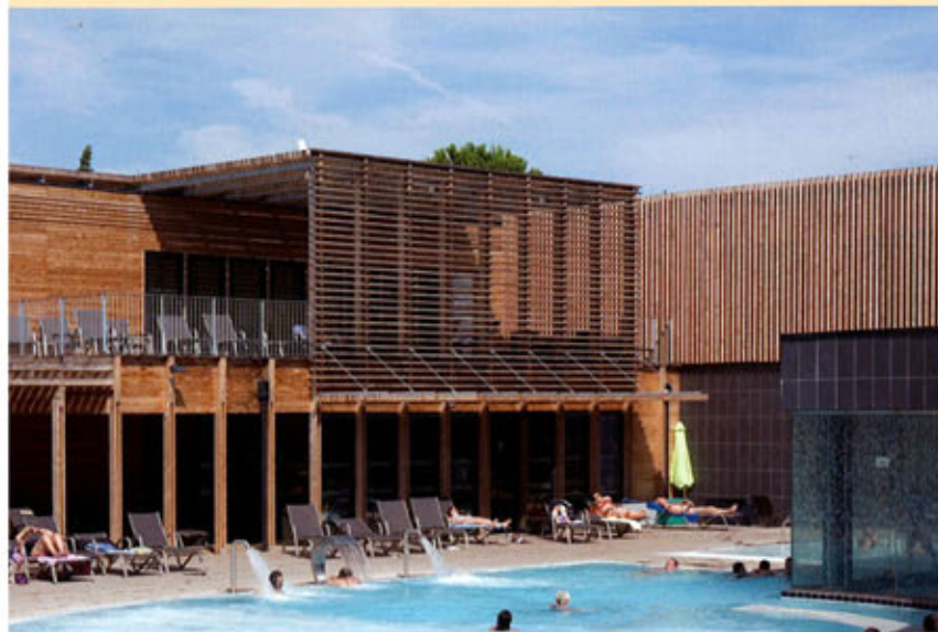
Centre thermoludique de Ballaruc-les-Bains (34), architectes : Tectoniques.

■ L'intérêt et la disponibilité pour les activités de loisirs, sportives ou culturelles, prennent aujourd'hui des formes beaucoup plus variées qu'autrefois. La palette des activités proposées au public est en constante progression. Il s'ensuit une offre d'équipements d'une grande diversité. La création de grands centres de loisirs comme les parcs d'aventures ou les centres aquatiques qui répondent à un fort besoin d'évasion constitue l'une des tendances significatives de cette évolution. Ces équipements, souvent à fort potentiel technique, sont de plus en plus souvent réalisés en bois en raison de la bonne adéquation entre ce type de programme et un matériau naturel alliant performances structurelles et environnementales. En parallèle, la demande croissante de loisirs familiaux de pleine nature s'accompagne de prestations d'hébergement de qualité qui nécessitent des constructions confortables et accueillantes. L'architecture de bois remplit pleinement ces conditions et propose un habitat de vacances, facile d'usage et riche de sensations. Ceci est vrai, non seulement pour les séjours de type hôtelier mais aussi pour l'hébergement de plein air, comme on le voit dans l'aménagement des campings présentés dans ce numéro.